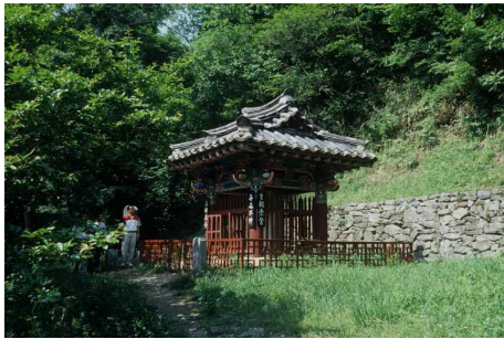
그림 9. 순창 삼인대

현재 ‘갈재길’이라는 이름으로, 백양사역에서 입암면사무소까지 약 11.2km 도보 여행 코스로 만들어졌다. 이 코스는 조선시대로부터 근대에 이르기까지 역사와 소통하며, 아름다운 옛 전설들을 만날 수 있는 길이며, 삼남대로(전남 해남~서울) 중에서 옛길의 흔적이 가장 잘 남아있는 곳으로 전남과 전북을 잇던 소통의 길이란 상징성이 있는 탐방로이다. 16)