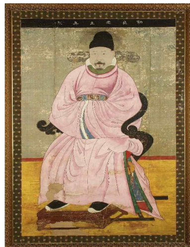
그림 6. 눌재 박상 초상화(訥齋 朴祥 肖像畵)(국가유산청)