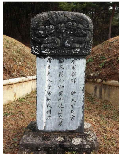
그림 8. 박상-눌재 박상 묘비(광주광역시 서구문화원)