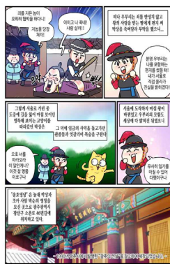
그림 16. 놀재 박상과 고양이 전설 웹툰(2)