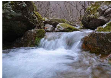
그림 10. 장성새재길 내내 만날 수 있는 계곡(파이낸셜뉴스)