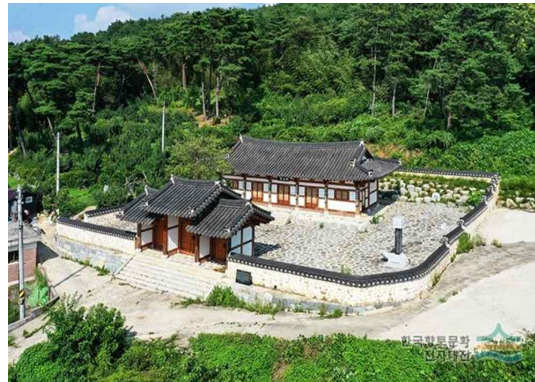
그림 4. 봉산재(鳳山齋)(항토문화전자대전)