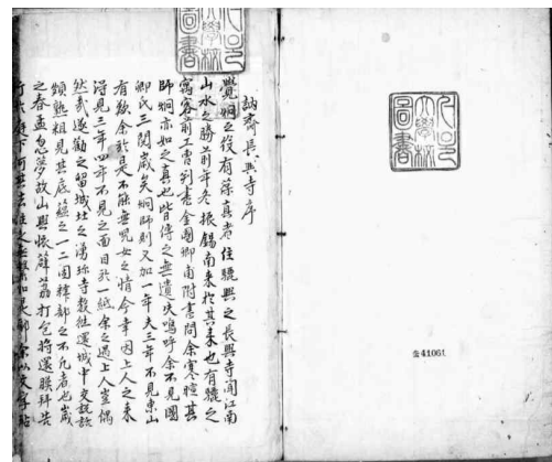
그림 2. 필사본 『놀이집』, 서울대 규장각한국학연구원(奎4203)