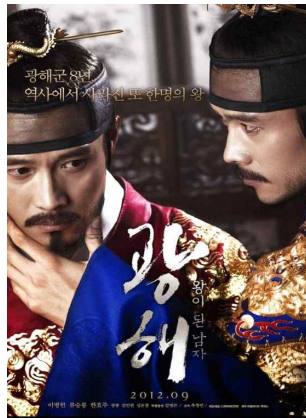
그림 13. 광해, 왕이 된 남자