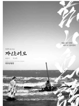
그림 14. 자산어보