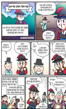
그림 15. 놀재 박상과 고양이 전설 웹툰(1)

한국 사극 드라마는 2000년대 이후 「주몽」, 「대장금」, 「허준」 등 영웅의 성장과 성공을 다루는 서사, 숙명의 라이벌 구도와 위기 극복 플롯을 통해 대중적 인기를 얻었다. 최근에는 「옷소매 붉은 끝동」, 「슈룹」 등 퓨전 사극이 등장하여 역사의 빈 곳을 공략하고 현대적 요소를 가미하며 대중의 관심을 증대시키고 있다. 해외 시청자들은 한국 사극의 풍경, 한국