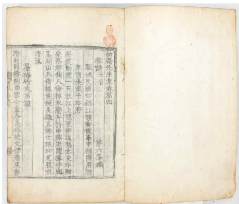
그림 1. 목판본 『놀이집』, 한국학중앙연구원 장서각(PD3B-1165A)

다음으로, 간행 연도 미상의 필사본은 8권 2책(乾·坤)으로 구성되어 있는데, 본집 7권과 보유(補遺) 1권이다. 보유 1권에 실린 작품은 속집 4권의 「청송당기(聽松堂記)」에서부터 「염불사중창기(念佛寺重創記)」까지이다. 현재 한국학중앙연구원 장서각, 서울대 규장각한국학연구원, 연세대 등에 소장되어 있다.