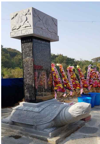
그림 7. 눌재 박상 행장비(訥齋 朴祥 行狀碑)(광주광역시 서구문화원)