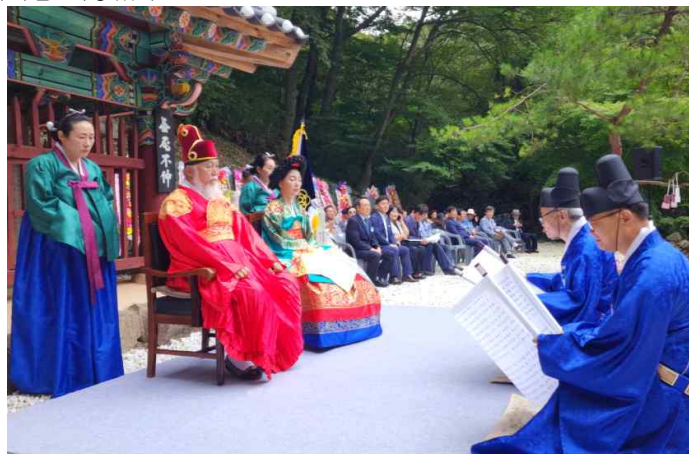
그림 18. 2024년도 제28회 삼인 문화 기념행사 개최