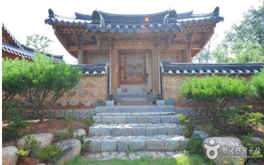
그림 3. 송호영당 전경

- 개설: 놀재 박상의 재실(齋室)이다. 뒷산의 이름이 봉황산이어서 박상을 봉산거사라 하였으며, 재각의 이름도 여기서 따와 봉산재라 하였다. 봉산재의 본체는 정면 4칸, 측면 1칸 규모의 한식 기와 팔작지붕 목조 건물이다. 재실 입구에 완절문(完節門)이라는 편액이 있는 솟을대문이 있다. 재실에는 기문이나 재각기는 없고 상량문에 “을미구월초육일(乙未九月初六日)”이라 쓰여 있다. 재실 앞마당에는 굴정(橘亭) 윤구(尹衢)가 쓴 행장비가 세워져 있다. 10)