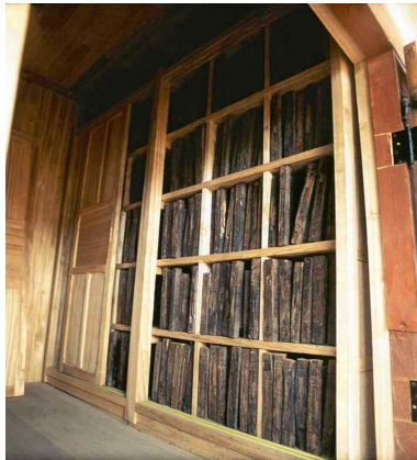
그림 5. 눌재집목판각(訥齋集木版刻)

- 굴정(橘亭) 윤구(尹衢, 1495~?)가 박상이 세상을 떠난 지 1년 후인 1531년 4월에 두 아들 부사공 박민제와 진사공 박민중의 요청으로 쓴 글이다. 윤구는 윤선도(1587~1671)의 증조부이다. 윤구는 1516년 식년 문과에 급제하여 지제교, 경연 검토관, 춘추관 기사관 등을 역임한 문신이다. 이 글은 당시 바로 쓰였기 때문에 박상의 진면목을 알아볼 수 있는 귀중한 글로 그 의미가 크다. 『눌재선생집(訥齋先生集)』 부록(附錄)에 실려 있다. 13)