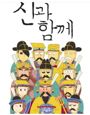
그림 12. 웹툰 「신과 함께」