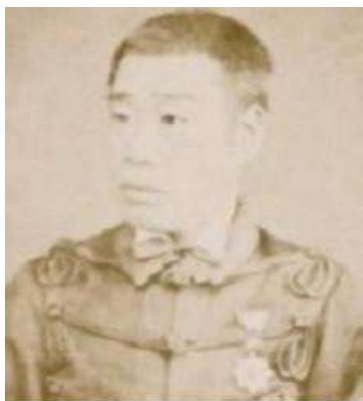
★동학농민군 학살 사령관 미나미 고시로(南小四郎, 1842~1921) © 정제

다시 10월 14일(양력 11월 11일)에 일본군 후비보병 독립 제19대대의 대대장 미나미 고시로 소좌는 이노우에 카오루(井上馨) 일본공사로부터 동학당 토벌에 관한 특별훈령을 다시 받았다. 23)