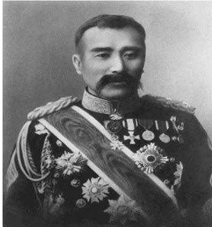
★가와카미 소로쿠(川上操六, 1848~1899).

견도 결정하였다. 같은 날 밤 9시 대본영에 있던 가와카미 병참총감이 “향후 동학당을 모조리 살육할 것”이라는 명령을 조선에 있는 남부병참감부와 인천병참감부에 내렸다. 21)