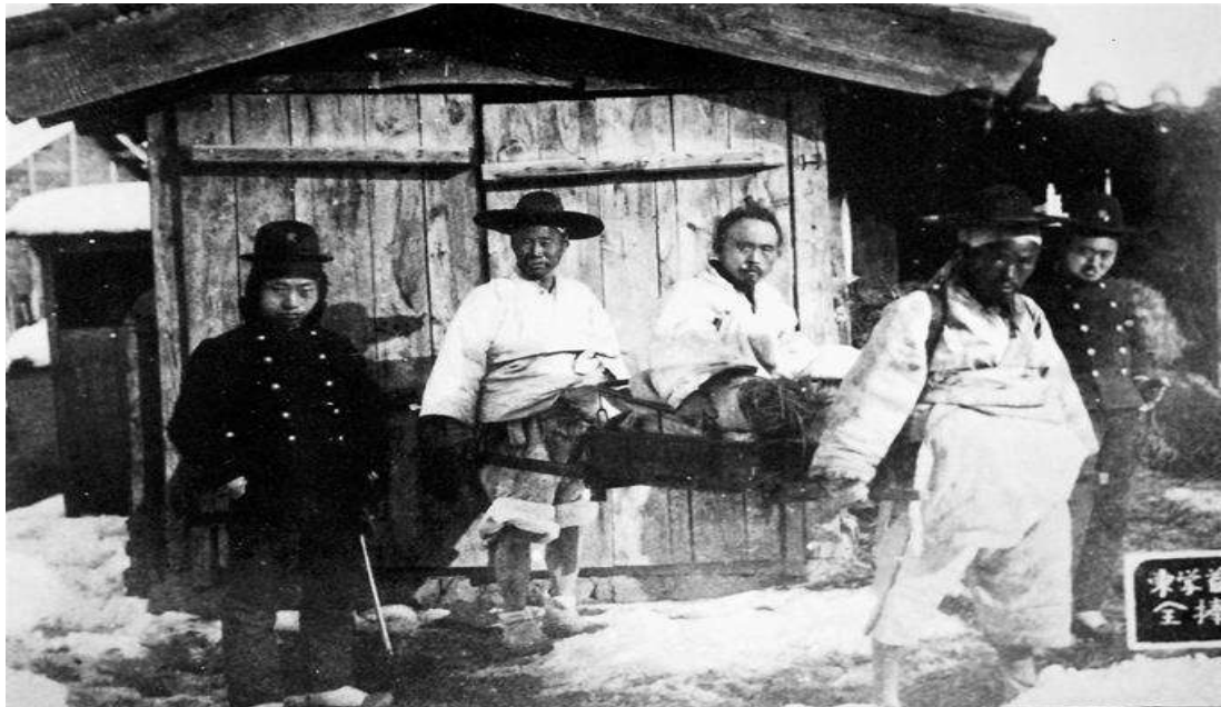
★전봉준 장군이 일본영사관에서 심문을 받은 뒤에 찍은 마지막 모습(1895년 2월 27일)

전봉준(1855~1895)은 일제의 국권침탈을 반대하여, 1894년과 1895년에 걸쳐 일본군을 몰아내기 위해 2차 동학농민혁명을 일으켜 일본군과 싸웠고, 일본군에 맞서 항거하다가 체포되어 순국하였다. 2차 동학농민혁명을 이끈 항일투쟁의 총사령관이었다.